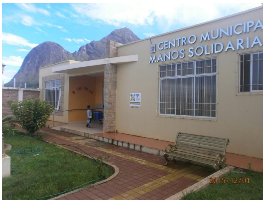
Fig. 1. Centro Municipal de Desarrollo Social Manos Solidarias

En la actualidad el Centro de Atención Prioritaria Manos Solidarias viene funcionando aproximadamente unos 4 años atrás, y hasta el momento la demanda en servicios de atención ha sufrido un elevado incremento, lo cual hace imposible que esta entidad pueda seguir prestando valiosísimos servicios a la comunidad en general.